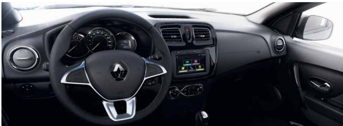
intens MT y CVT